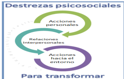
Figura 2. La naturaleza y función de las diez destrezas psicosociales

Estas diez destrezas son aplicables en tres dimensiones: en las acciones personales, en las relaciones interpersonales y en el medio ambiente. En la figura 2 se puede visualizar su función en cuanto a las tres dimensiones.